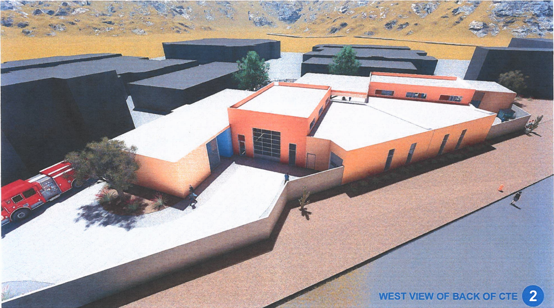
WEST VIEW OF BACK OF CTE 2